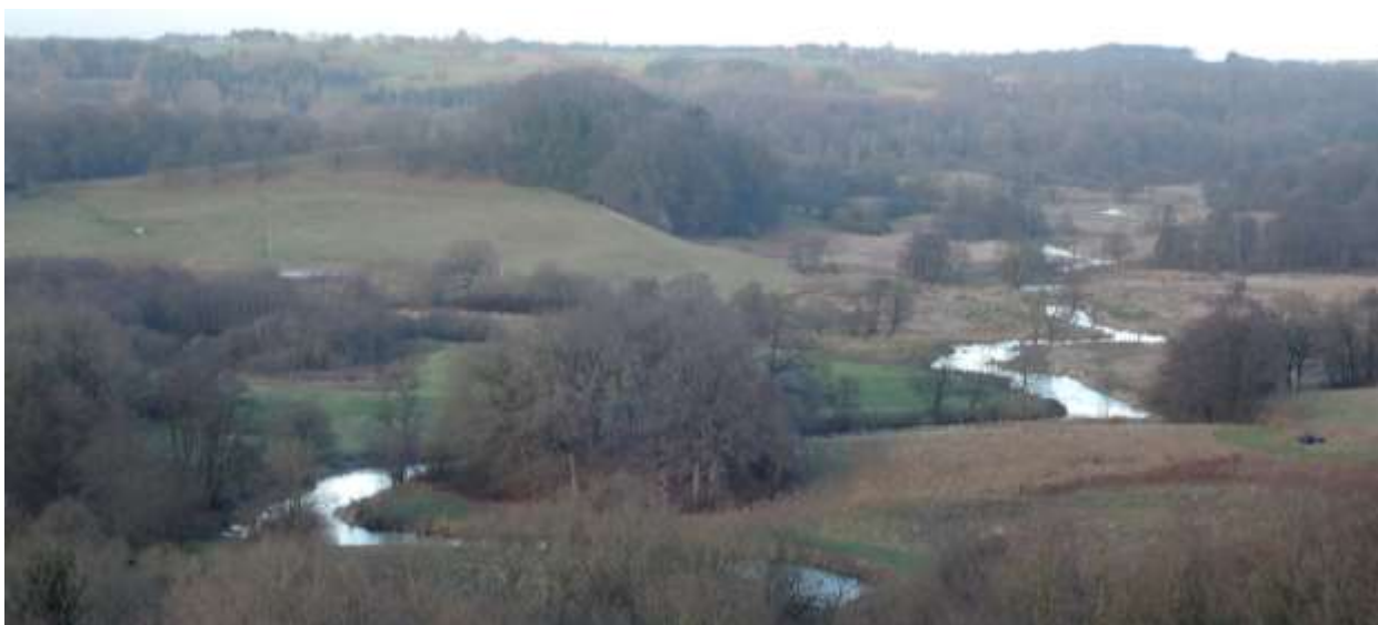
Udsigt fra Tørskind mod øst. På billedet ses en 2 km strækning af Vejle Å, som blev genslynget i 2010.

Landskabsmosaikken, sammensat af sporene efter den menneskelige foretagsomhed i ådalen gennem årtusinder, ændrer sig hele tiden. Mosaikperler forsvinder og andre kommer til. Et af 1990-ernes bidrag til mosaikken er nye slyngede vandløb, kaldet omløbsstryg, forbi de århundreder gamle møllespærringer, således at fiskene atter kan vandre frit op ad åløbene.