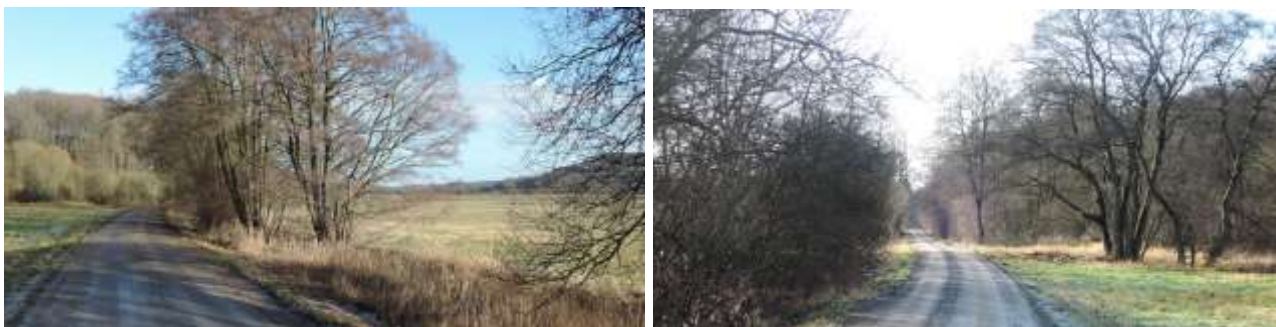
Bindeballestien øst for Ravning.

På nordsiden af Vejle Ådal er anlagt en sti, Bindeballestien, på den tidligere Vandel Jernbanes sporareal. Den er 23 km lang og starter på Vestbanevej i Vejle og ender ved Bindeballe. Stien fører gennem nogle af Vejle Ådals mest uberørte landskaber og er en regional cykel- og vandrerute. Bindeballestien er desuden en del af den nationale hærvejsvandrerrute, som går til Jelling. Langs ruten er der en bred vifte af oplevelser og faciliteter, og der formidles flere temaer. Et nyere tema er pilgrimsvandring, og her rækker forbindelsen helt ud i Europa.