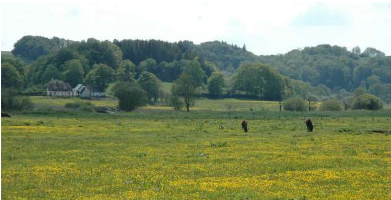
Vejle Ådal set fra Ravningvej mod vest. I midten af billedet ses forløbet af Ravningbroen.

Vejle Å udspringer ved Engelsholm Sø længere nord på, og løber fra nord ind i området. Ved Sønderkær forenes den med den sydfra kommende Egtved Å, og i fællesskab søger de videre mod nordøst gennem et bredt dalstrøg, der er skabt før den sidste istid, men eroderet yderligere af isen, jf. ovenstående.