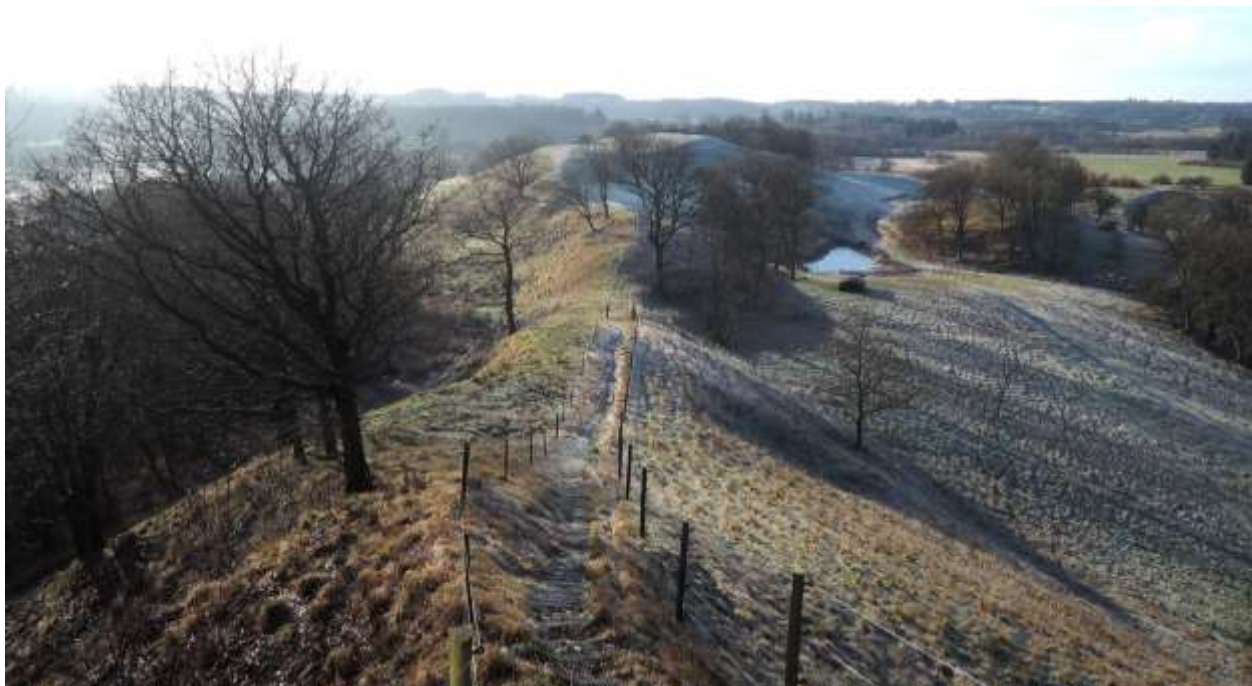
Runkenbjerg er en falsk bakke. Det oprindelige landskab omkring Runkenbjerg er eroderet bort af is og smeltevandsstrømme i istiden og af Vejle Å efter istiden. Billedet er taget fra øst.

bakke eller gammel dalbund, der ved floderosion både under og efter isens tilbagetrækning er blevet eroderet på begge sider, så den nu fremstår som en smal ryg.