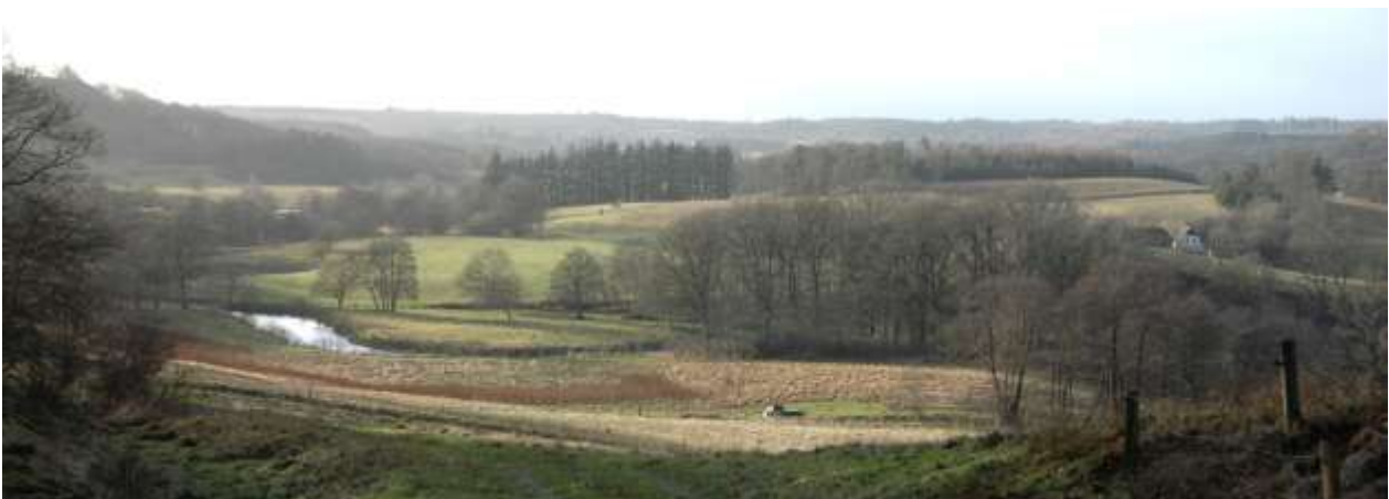
Vejle Ådal mellem Ravning og Tørskind mod vest.

Baggrunden for den valgte afgrænsning er områdets store landskabelige værdier og relative uberørthed. Med den foreslåede fredning skabes endvidere en sammenhæng med den eksisterende Nybjerg Møllefredning, som blev gennemført i 1980. I 1984 indgik Vejle Ådal med dens sidedale i den daværende Fredningsstyrelses oversigt over Danmarks større nationale naturområder, og blev prioriteret højt som et af landets mest storslåede tunneldalslandskaber. I 2009 fik Danmark en naturkanon, og her er Vejle Ådal og Vejle Fjord omfattet med den begrundelse, at det er den mest imponerende af de dale, der præger Jyllands østkyst. I 2013 vedtog Miljøministeren en ny Handlungsplan for fredninger. Den har, som et af tre højt prioriterede hovedformål, Perlerne – de unikke, vigtigste og nationalt værdifulde lokaliteter. Handlungsplanen er ikke geografisk funderet, men Vejle Ådal vil være et naturligt fokus for en kommende fredningsindsats på linje med andre af vores nationalt værdifulde lokaliteter, der nyder den særlige beskyttelse, som fredning giver.