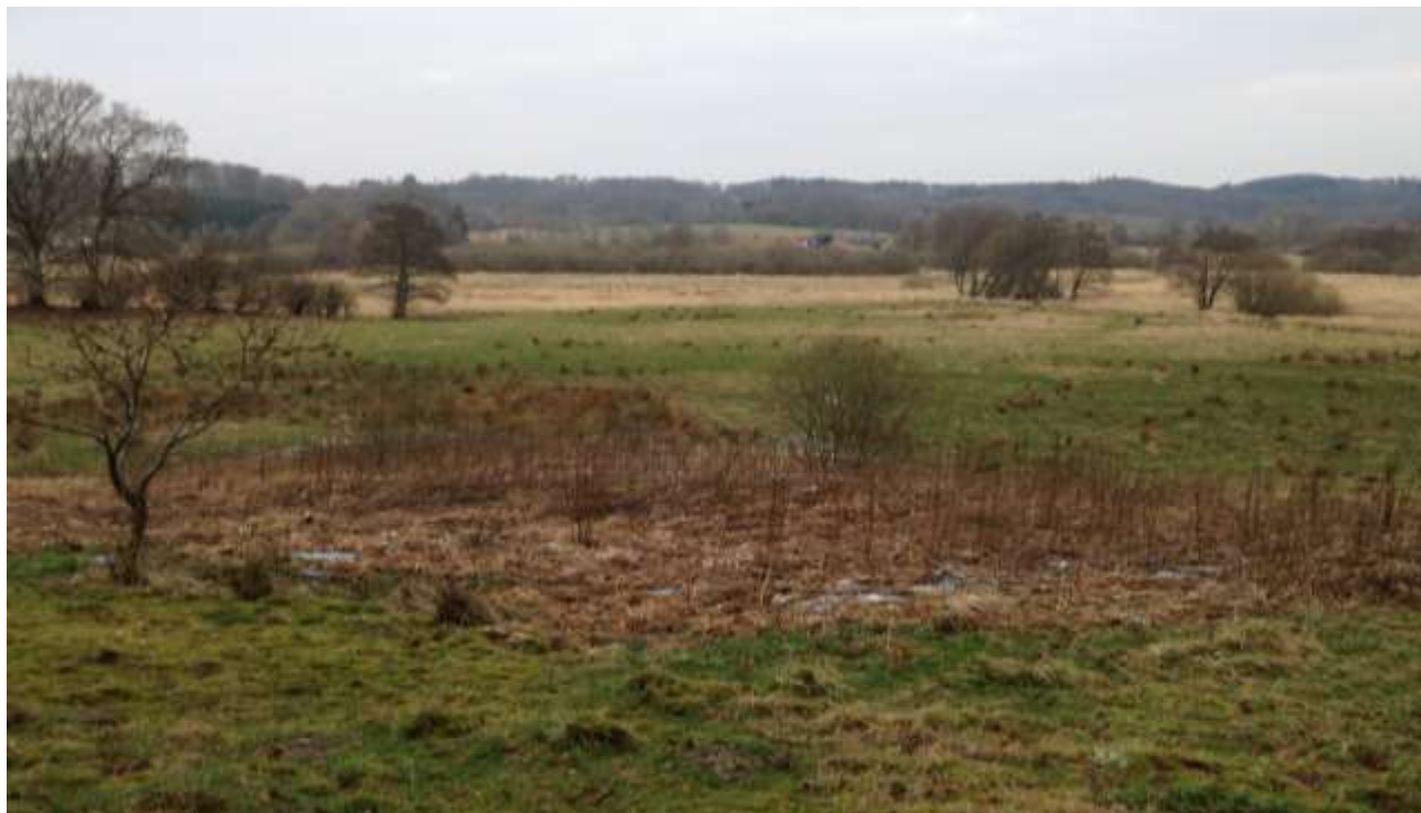
Vejle ådal er bred med fugtige enge langs åen. I horisonten ses de skrånende delvist skovklædte dalsider.

Fredningsforslagets afgrænsning fremgår endvidere af kortbilag 1.