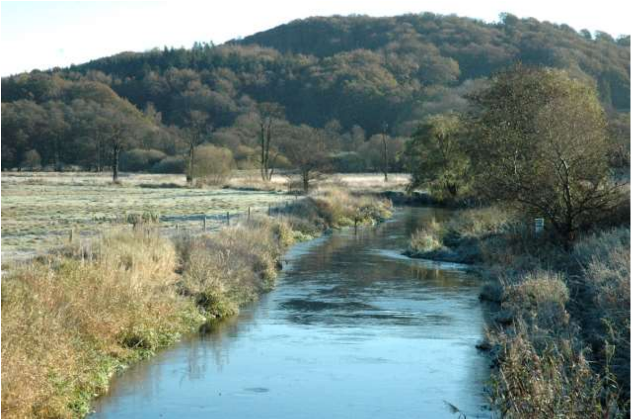
Vejle Å set fra Ravningvej mod sydøst. I baggrunden ses Vesterby Skov.