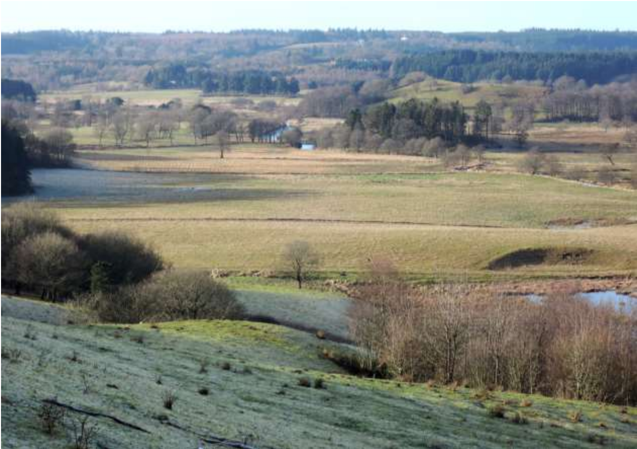
Udsigten fra Tørskind (i Nybjerg Mølle-fredningen) mod vest.