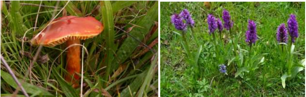
På billedet tv ses skarlagens vokshat. Th ses tyndakset gøgeurt.

Hvor der presses vand ud af skrænterne, vokser maj-gøgeurt, mens Skov-gøgelilje og Tyndakset gøgeurt ses på Runkenbjerg.