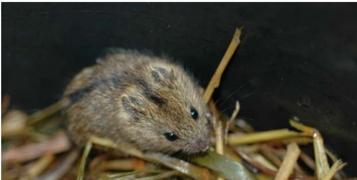
Birkemusen kendes på den lange hale og ved den sorte stribe langs ryggen, som når helt frem mellem øjnene.