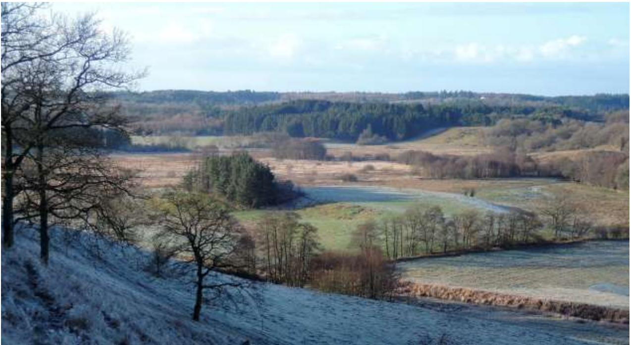
Udsigt fra Runkenbjerg over Sønderkær, som rummer en af Danmarks største koncentrationer af bopladser fra jægerstenalderen.

Vejle Ådal har været beboet af mennesker siden slutningen af sidste istid. Fund af flinteredskaber afslører bopladser fra nogle af ådalens tidligste indbyggere, stenalderjægerne, som for 9000 år siden drev jagt og fiskeri i den frodige ådal.