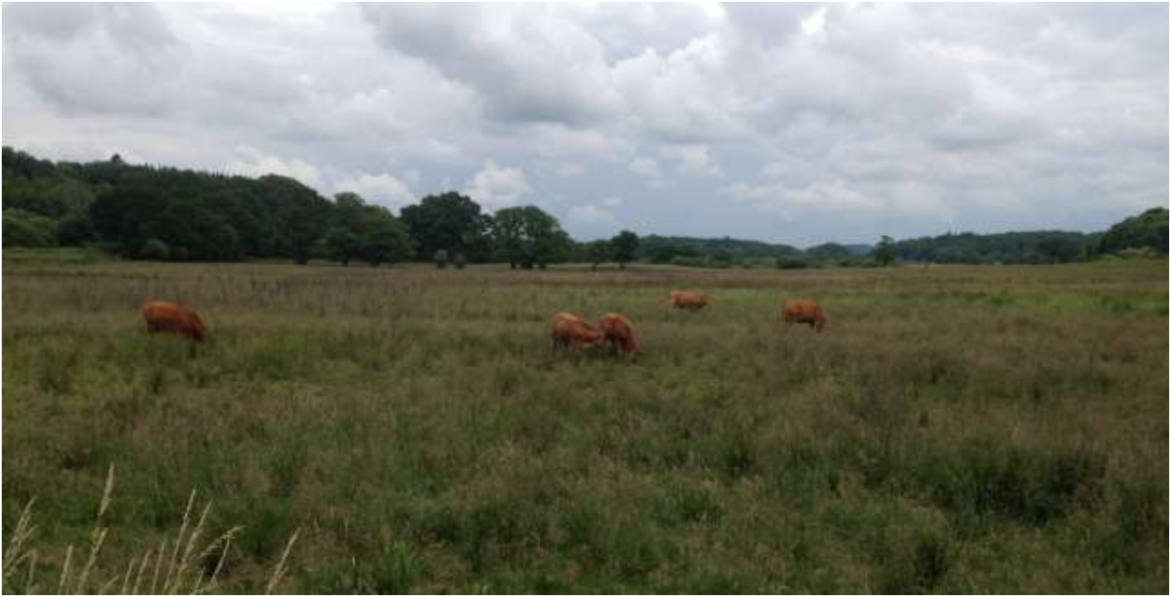
Mange steder i ådalen går der dyr og græsser og sørger for naturplejen. Her græssende køer langs Bindeballestien.