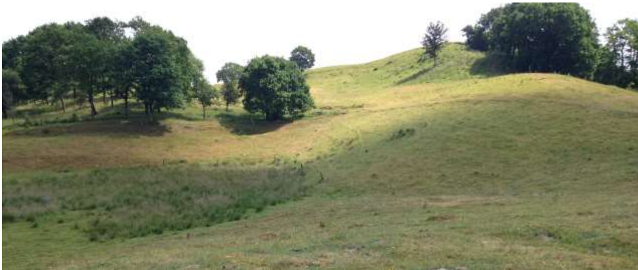
Overdrevet på Runkenbjerg hvor 18 forskellige vokshatte vokser.

Det er blandt andet Runkenbjerg og Lyngholm, der er omfattet af Natura2000-beskyttelsen, og disse markante bakker har da også nogle af Vejle Ådals mest værdifulde overdrev.