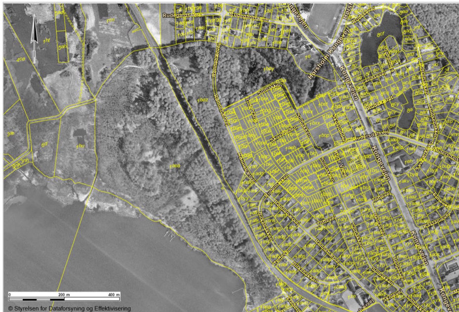
Illustration 3: Ortofoto 1954.

I perioder har kommunen friholdt en rydning omkring den lille holm i elleskoven, hvor den tidligere omtalte mindesten er placeret. Rydningen har dannet en udsigtskile fra mindestenen, med vue ud over Furesø mod vest.