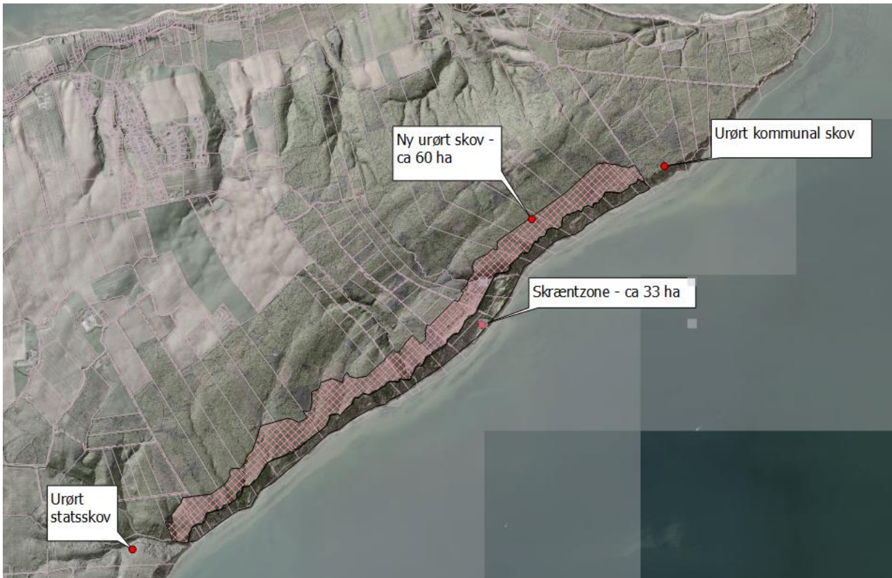
Figur 2. Forslag til urørt skov