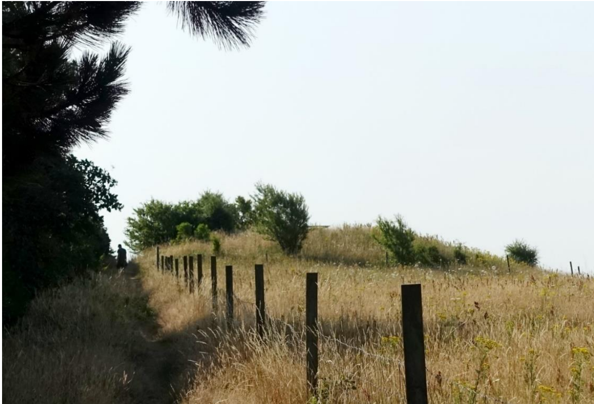
Foto 7: Gravhøje ligger ofte placeret højt i terrænet, hvilket også er gældende for de to beskyttede gravhøje inden for fredningen.