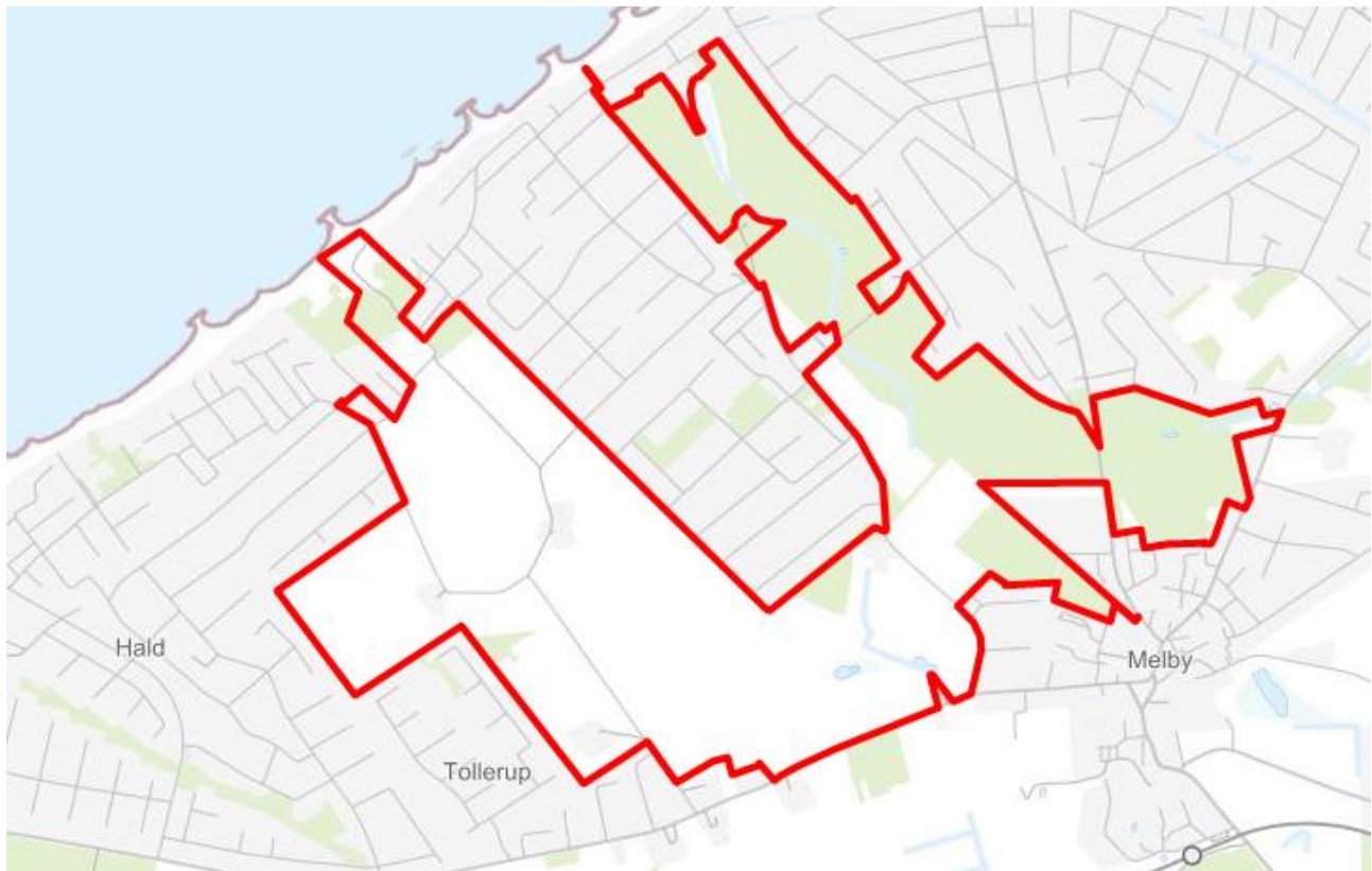
Figur 1: Oversigtskort over fredningsområdet.

Samlet set dækker kilerne et areal på 166 ha. Fredningsforslagets afgrænsning fremgår endvidere af bilag 1 og i oversigtsform i figur 1 nedenfor.