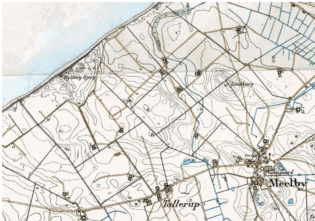
Figur 3: På de gamle målebordsblade er det tydeligt at se de gamle diger, der markerede ejendomsskel om de enkelte gårde. Digerne er tegnet med sort streg.