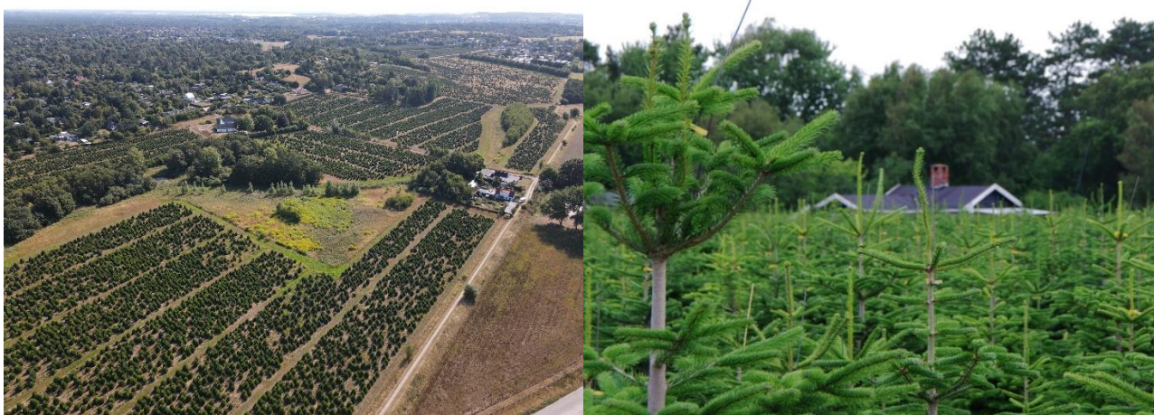
Foto 1 og 2: Den omfattende juletræsproduktion i Melby Kilen har stor betydning for oplevelsen af landskabet.

Jorden er i den nordlige ende overvejende ferskvandstørv, mens den mod syd består af smeltevandsgrus. Størstedelen af kilen er i 2022 beplantet med juletræer omkranset af et 160 cm højt vildthejn; tidligere blev jorden dyrket med lave enårige afgrøder.