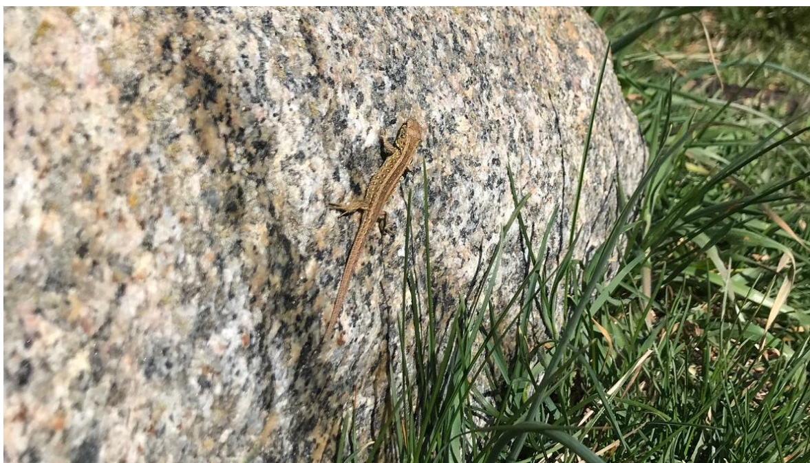
Foto 6: Markfirben lever på overdrev og kystskrænter i Halsnæs Kommune og er helt afhængige af ledelinjer til at bevæge sig rundt i landskabet.

Digerne i Tollerup og Melby Kilerne består af tør og mager jordbund, der giver mulighed for at en lang række arter, der er tilpasset denne jordbundstype, kan trives. Som følge af gødskning og kvælstoftilførsel er næringsfattige naturtyper generelt truede og i tilbagegang. Digerne har derfor stor betydning både for denne naturtype og som spredningskorridor for arter, der bl.a. bruger diger som ledelinier for deres færden i det åbne land.