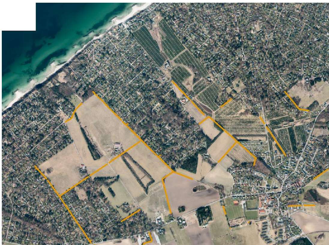
Figur 4: Luftfoto af området med markering af de tilbageværende beskyttede diger med brun streg.