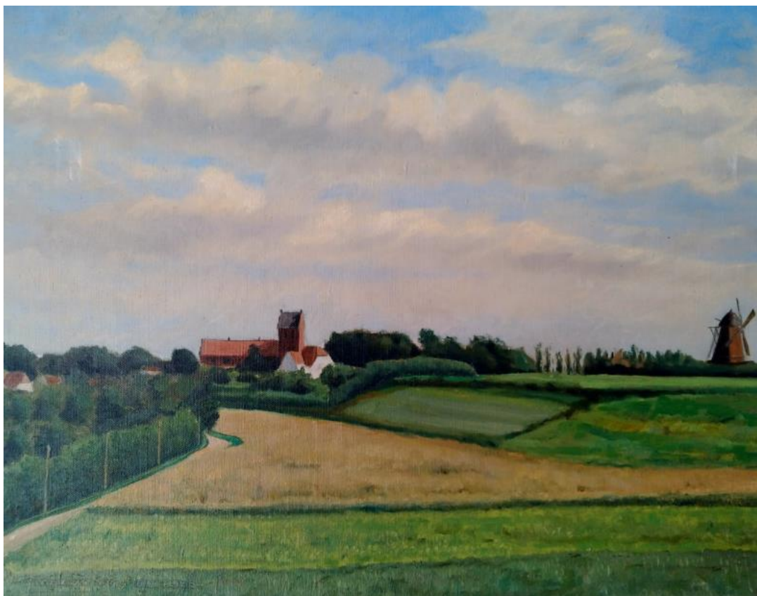
Maleri: Melby 1938 K. Gottlieb

De to kiler er kendetegnet ved deres smukke kuperede landskaber, der adskiller tæt-bebyggede sommerhus- og byområder og fungerer som grønne bånd mellem hav og land. Kilerne rummer flere kulturhistoriske spor, som det er vigtigt at værne om, og de er blandt de sidste grønne kiler langs Sjællands nordkyst, der ikke er fredede. Dette klassiske morænelandskab ønsker Halsnæs Kommune og Danmarks Naturfredningsforening at give den bedst tænkelige beskyttelse, så fremtidige generationer, ligesom vi, kan nyde oplevelsen af det smukke kystnære landskab.