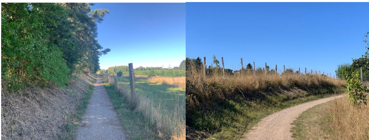
Foto 4 og 5: Eksempler på beskyttede diger langs Æblestien i Melby Kilen.

I dag er der registreret 5,23 km (Tollerup Kilen 3,26 km, Melby Kilen 1,97 km) beskyttede diger inden for fredningsområdet, hvilket kun er en brøkdel af de mange diger, som tidligere har eksisteret i området. Digerne er blevet sløjfet i takt med sammenlægning af marker til større og større dyrkningsflader. Digerne er med til at fortælle historien om menneskets påvirkning af landskabet og naturen især gennem de seneste 1100 år. Her særligt med henblik på historien om Danmarks inddeling i sogne, landsby- og herregårdsejerlav, om drift af marker samt beskatnings- og ejerforhold.