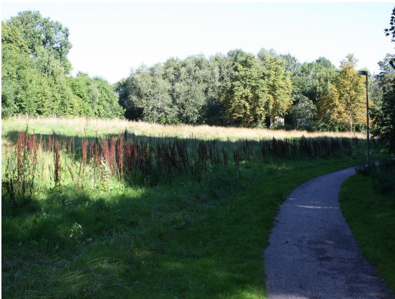
Figur 3: Lysåbent areal i fredningsområdets nordlige ende.