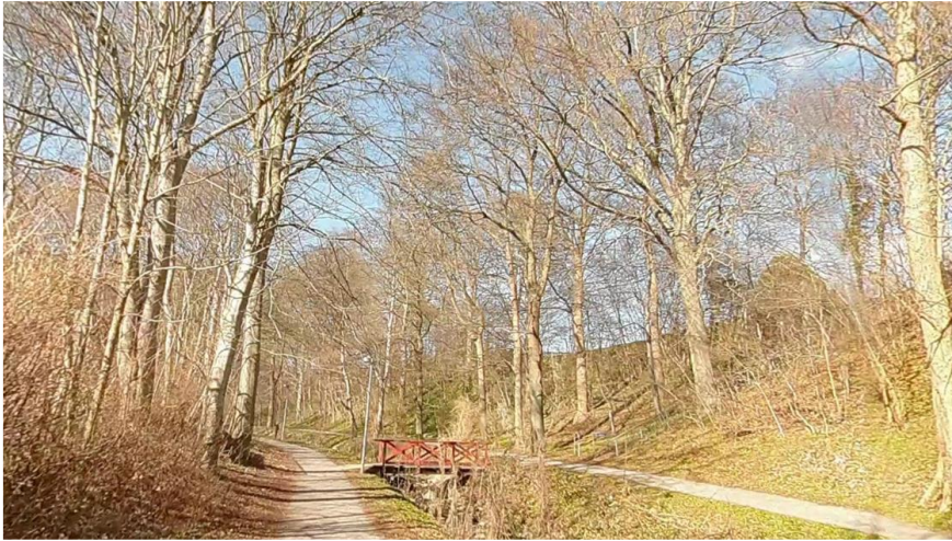
Figur 2: Google Street View af Bækkestien set mod nord, med Ladegård Bæk og hhv. cykelsti mod vest og sti til fodgænger mod øst.