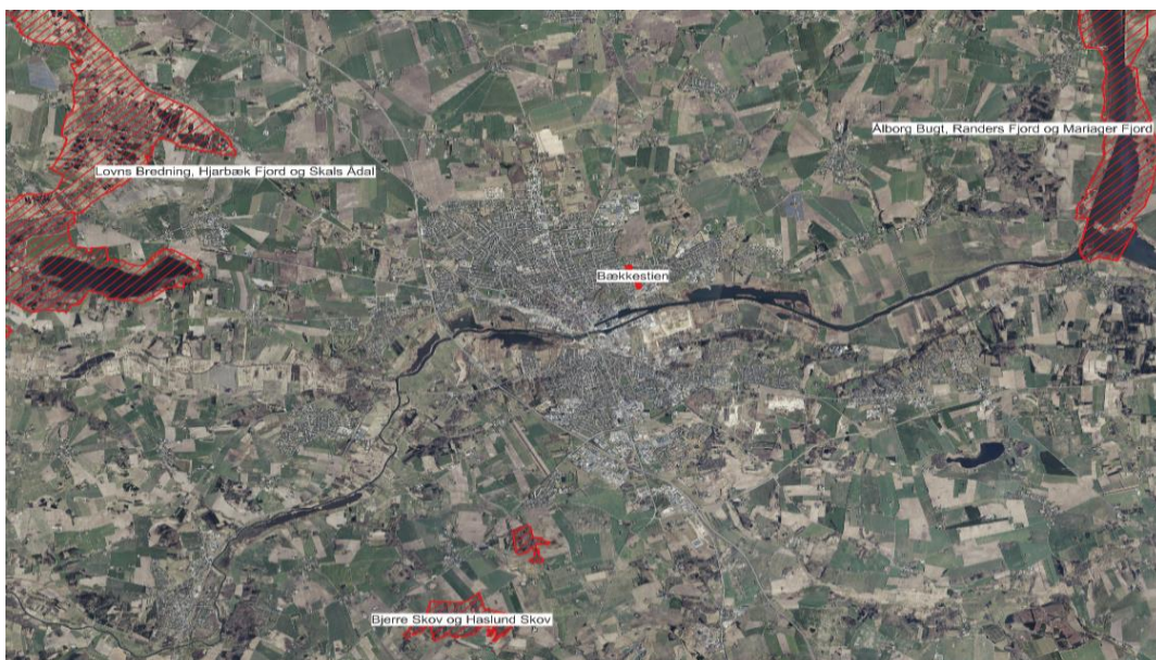
Kort 4: Oversigtskort over placering af de 3 nærmeste Natura 2000-områder i forhold til Bækkestien.