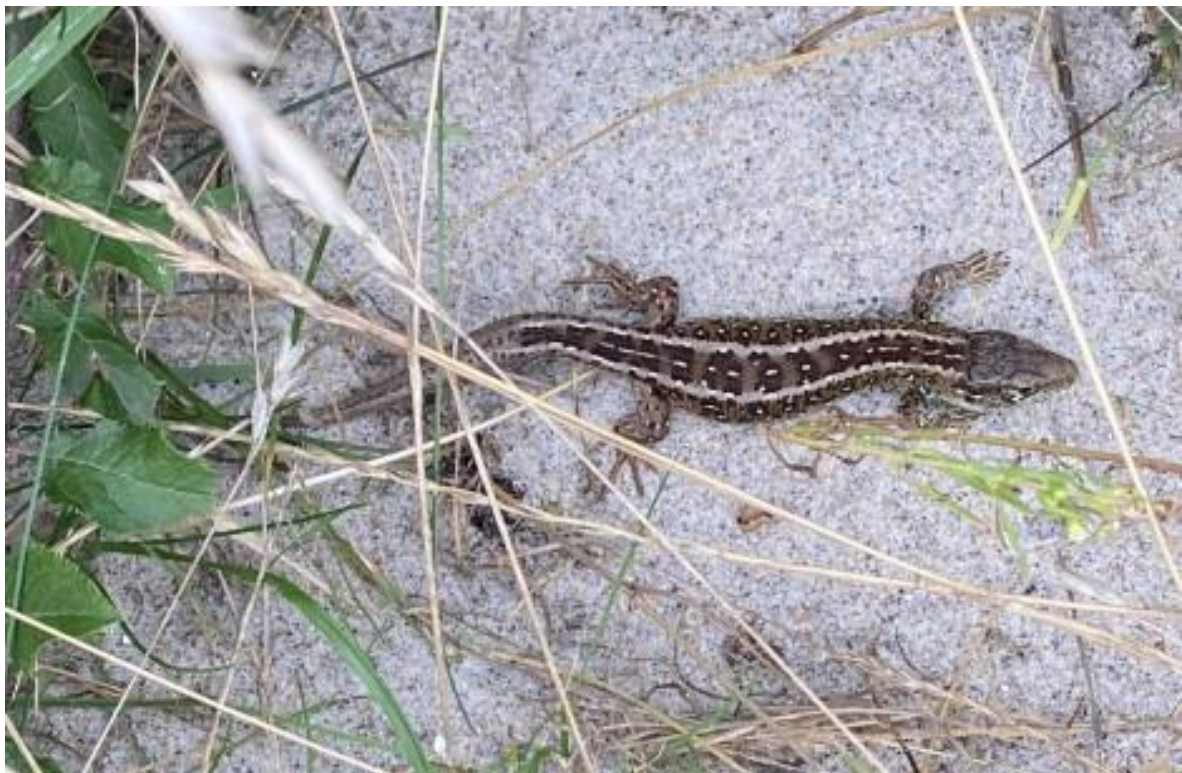
Ovenover Markfirben, som blandt andet kendes fra det almindelige firben ved en smal, hvid punkteret linje midt ned af ryggen.

Markfirbenet har længe haft en bestand på den gamle skydebane på Næstved Øvelsesplads. Området ligger i dag lige vest for Næstved Øvelsesterrænet, da Ring Øst har gennemskåret skydebanen. Tilsvarende findes en bestand ved cykelstien "Laugstien" som afgrænser Øvelsesterrænet mod syd. Det er derfor meget sandsynligt, at arten også er, eller vil kunne etablere en bestand på selve øvelsesområdet.