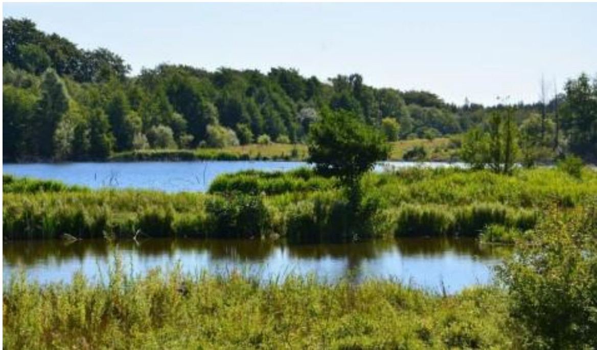
En af de større søer i området. Vandet skaber variation og grundlag for mere liv på øvelsespladsen.

Mellem depotbygningerne og Tørvemosen i områdets østlige del er ca. 3 ha fredskovspligtigt areal.