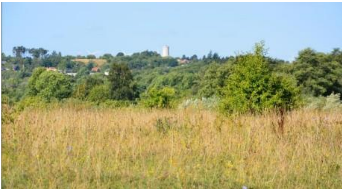
Vandtårnet rager op som et fyrtårn på Vandtårnsbakken, som for nylig blev fredet.

Istidshistorien er vigtig for øvelsespladsen og flere af de omkringliggende arealer. Ikke langt fra øvelsespladsen ligger Mogenstrup ås, der er Sjællands største ås. Landskabsmæssigt indgår terrænet derfor i et større sammenhængende område, der har stor betydning som eksempel på landskabsdannelsen i Danmark.