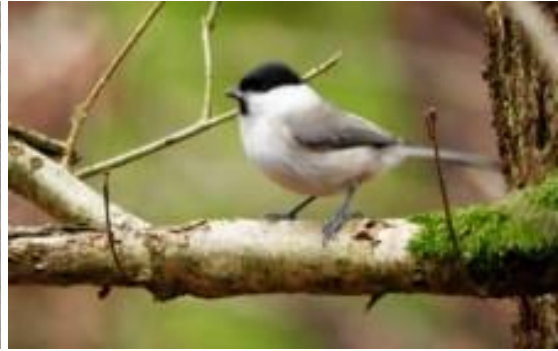
Tv gråstrubet lappedykker. Th sumpmejsje.