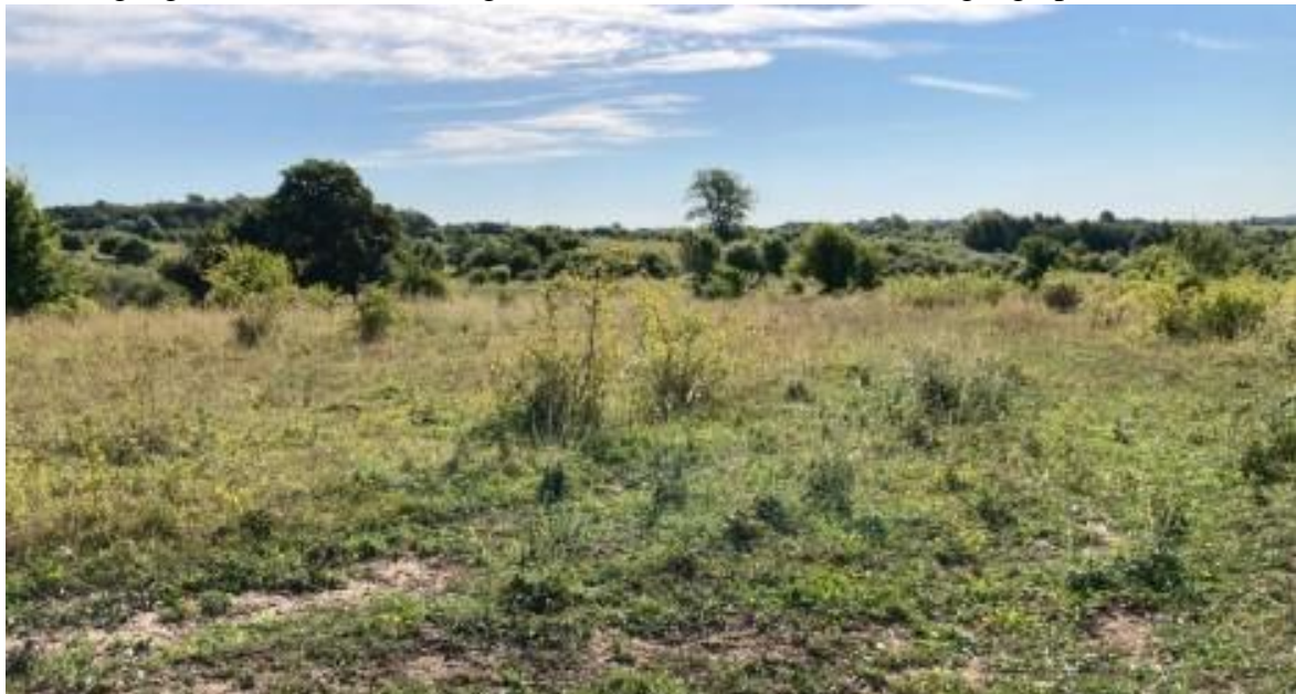
Næstved Øvelsesplads er et halvåbent landskab med mange lyskrævende planter.

Næstved Kommune og Danmarks Naturfredningsforening ønsker gennem en fredning at sikre, at de enestående naturværdier, som Næstved Øvelsesplads rummer, bevares og at offentlighedens adgang sikres i al fremtid. Også hvis de militære aktiviteter engang ophører.