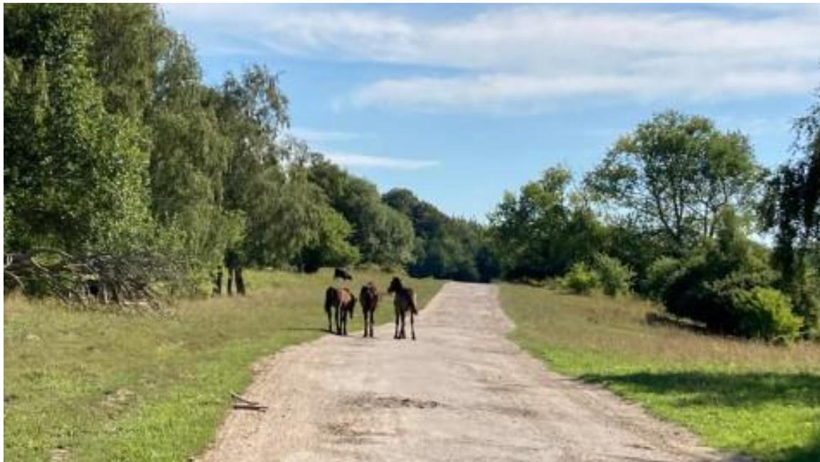
Føl af exmore-racen nyder sommeren og det frie liv på øvelsespladsen. Heste og kreaturer er i fællesskab med til at pleje naturen og sikre at området ikke gror til.

Begrebet 'rewilding' opstod i USA for 20 år siden. Ved at genintroducere nøgledyrearter, som er vigtige for områdets naturtilstand, kan man lade naturen gøre arbejdet selv i stedet for at pleje.