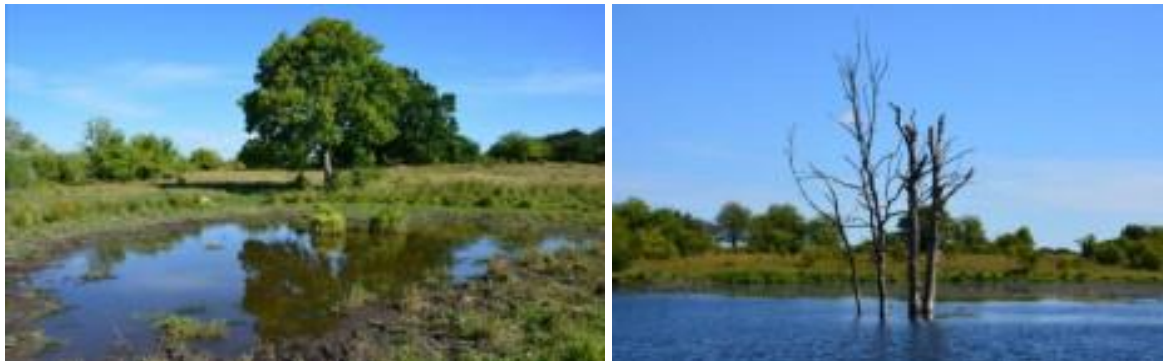
Tv. et lavvandet vandhul som dyrene bruger. Deres påvirkning af bredzonen skaber positiv dynamik. Th. oversvømmede træer fra hævet vandstand.

Bestandene af padder og krybdyr har det generelt godt på grund af de mange søer, småvandhuller og sumpede områder. Foruden de før nævnte padder og krybdyr er der registreret både snog, lille vandsalamander, grøn frø og springfrø på øvelsespladsen.