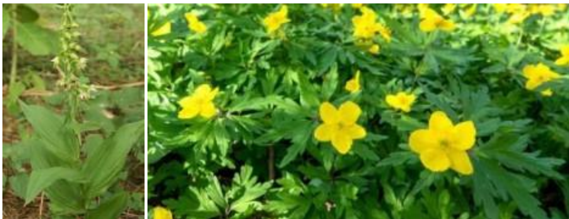
Tv. Skov Hullæbe. Th. Gul Anemone th. Fotos fra nettet.

Floraen byder ikke på meget sjældne arter men man kan dog støde på både skovhullæbe, blå og gul anemone samt flere af de mindre almindelige svampearter, som er indikatorer på, at området har ligget udyrket hen længe.